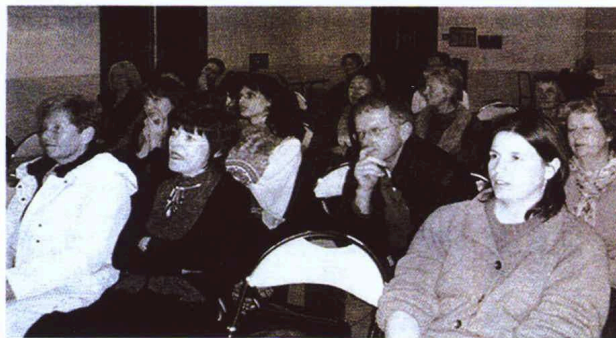
Le public d'une cinquantaine de personnes intéressées.

Ce massage est recommandé en cas de chute de cheveux ou de cuir chevelu congestionné ; il est effectué, lui aussi, le long des méridiens d'acupuncture avec des huiles essentielles appropriées.